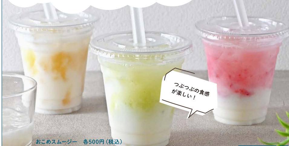
おこめスムージー 各500円(税込)