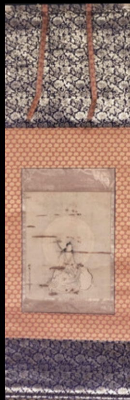
(伝) 普賢菩薩 狩野探幽