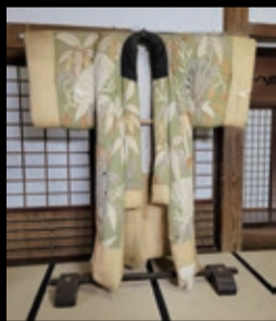
村松藩主奥方 千寿院様 着用掻巻