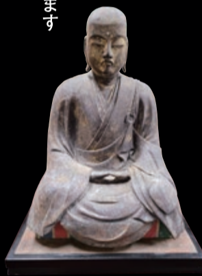
僧形 文殊菩薩 永正15年(1518年)3月 院派仏師作

狩野探幽の画や 楠木正成の遺状など 普段は見ることのできない 貴重な文化財を公開いたします