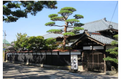
・五泉に残したい風景

ガイドと歩く 五泉シルクロード巡り。 歩いて・見て・聞いて・新しい発見があるかもしれませんよ！