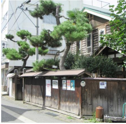
・趣のある建物です。