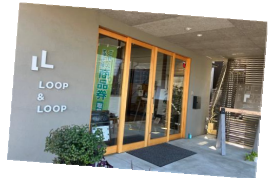
・莫大小？なんて読むの？