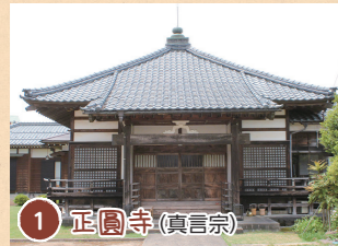
1 正圓寺 (真言宗)

村松で最も歴史の古いお寺で、延暦15年(796)の伝教大師最澄が創建と伝えられる、近隣随一の古刹。慈光寺、英林寺と並び、村松三ヶ寺のひとつ。境内に祀る観音堂は、越後三十三番のうち三十一番札所。市文化財指定の五輪線刻塔婆が11基ある。 ●五泉市村松甲6335-1 (寺町)