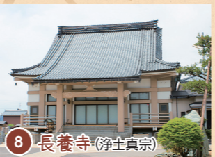
8 長養寺 (浄土真宗)