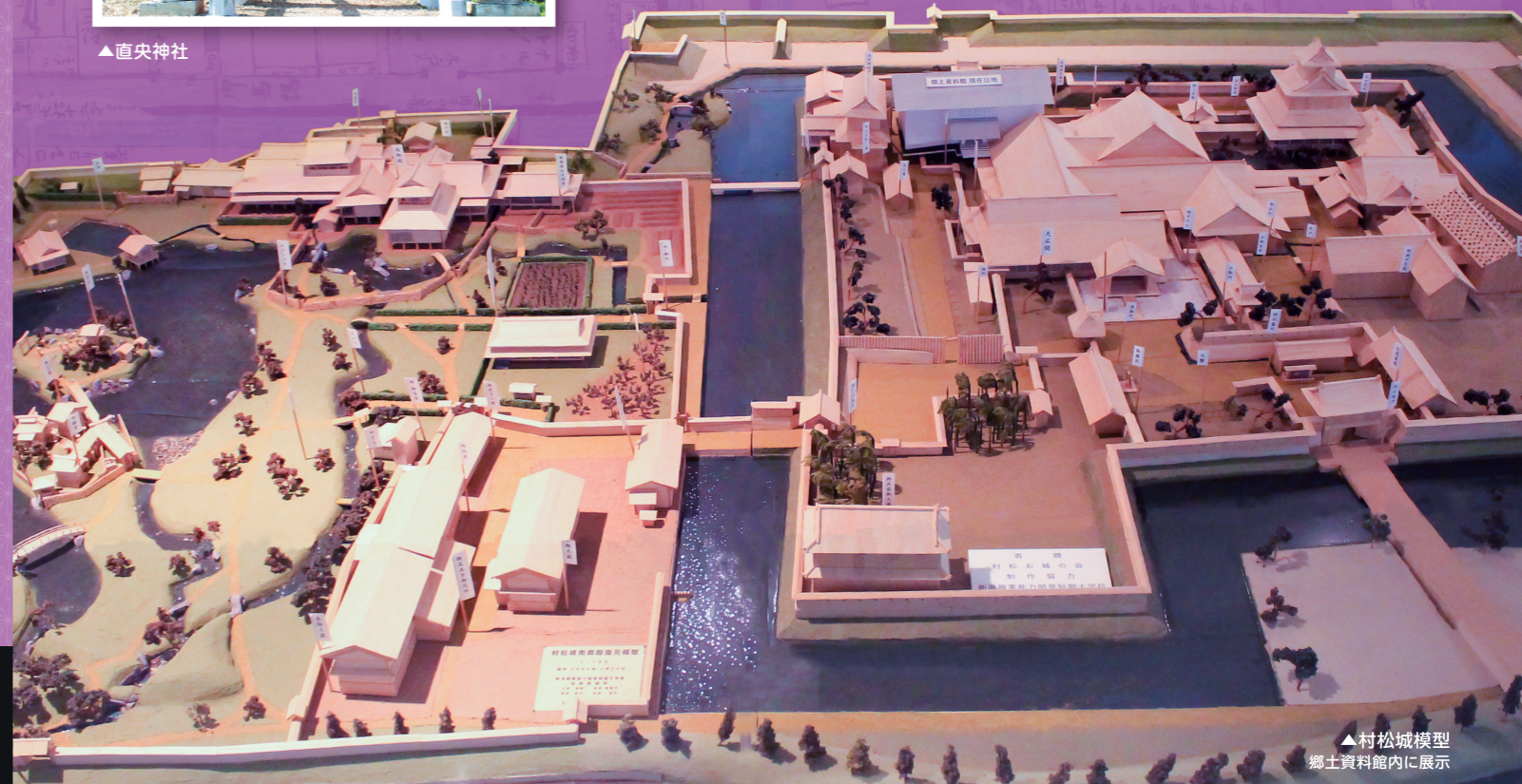
▲村松城模型 郷土資料館内に展示