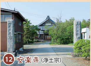
12 安楽寺 (浄土宗)

永享、文安の頃(1429-1449)川内村雷山城は太田拱津守安養という人が城主であった。安養の死後、その子が追善供養のために宝徳二年(1450)建立した寺。川内村熊沢から仲丁の辺に移り、正保2年(1645)堀氏の城下町づくりの際、今の位置に移った。 ●五泉市村松甲5792 (寺町)