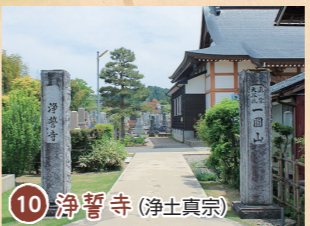
10 淨誓寺 (浄土真宗)