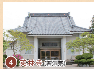
4 英林寺 (曹洞宗)

「寛延寺社帳」では正保年中(1644-47)現在の社が村松城鬼門に当るので、村上城の先例に準じ天満宮を勧請し、正圓寺に支配させたとする。庶民から学問、芸術の神として崇敬され、8月24日の宵宮には寺子の書道奉納や花火も打上げられ賑わったという。明治3年正圓寺支配を改め神宮支配となる。(横町)