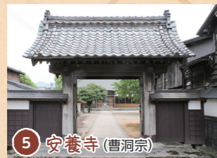
5 安養寺 (曹洞宗)