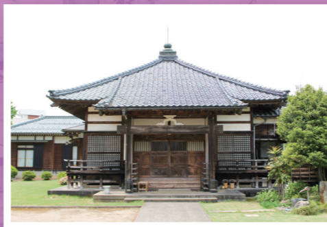
▲正圓寺 越後三十三観音 第三十一番札所