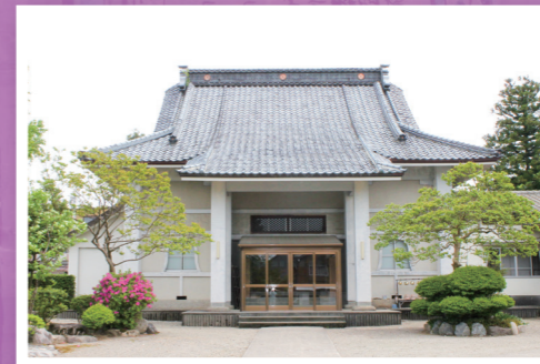
▲英林寺 村松堀家の菩提寺