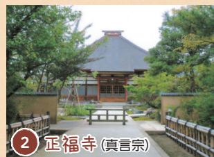
2 正福寺 (真言宗)

村松で最も歴史の古いお寺で、延暦15年(796)の伝教大師最澄が創建と伝えられる、近隣随一の古刹。慈光寺、英林寺と並び、村松三ヶ寺のひとつ。境内に祀る観音堂は、越後三十三番のうち三十一番札所。市文化財指定の五輪線刻塔婆が11基ある。 ●五泉市村松甲6335-1 (寺町)