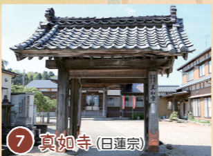
7 真如寺 (日蓮宗)