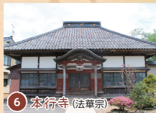
6 本行寺 (法華宗)