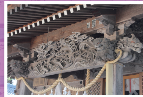
▲日枝神社 社殿彫刻 細野六左衛門 彫刻