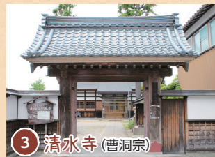
3 清水寺 (曹洞宗)

延暦15年(796)伝教大師最澄の創建と伝えられる古刹である。境内に、青面金剛・しあわせ観音を祀っている。庭園は全て杉苔に覆われており、特に、若葉、紅葉のモミジが美しい。 ●五泉市村松甲6345 (寺町)