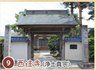
9 西往寺 (浄土真宗)