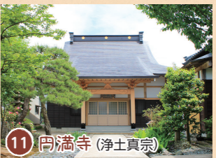
11 円満寺 (浄土真宗)