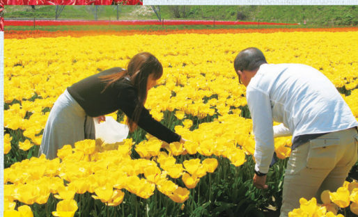
花摘み体験の様子